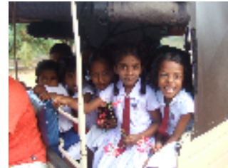
支援地域で 学校に通う子どもたち

住民自身が地域の問題を解決できるよう、住民組織を強化しています。家や道路の修繕、図書館の整備を行います。