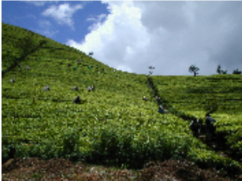
ヌワラ・エリヤの広大な紅茶プランテーション

チャイルドと家族の多くは栄養不良です。昼夜の気温差が大きい気候から、下痢や呼吸器系の病気に罹りやすいことも大きな問題です。安全な飲み水も不足しています。