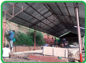
第5弾・第6弾のご支援で建設する校舎の工事を開始します(写真はイメージ)

皆さまから送っていただく書き損じハガキ(未投函のハガキ)や未使用切手を活用して、ネパールに教室をつくることを目的としたキャンペーンです。過去の第1弾から第4弾のキャンペーンにより、4つの学校に校舎を建てることができました。杉並区民の皆さまのご協力に心よりお礼申し上げます。