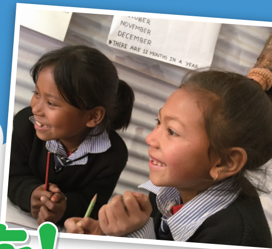
仮設教室で楽しそうに勉強する女の子