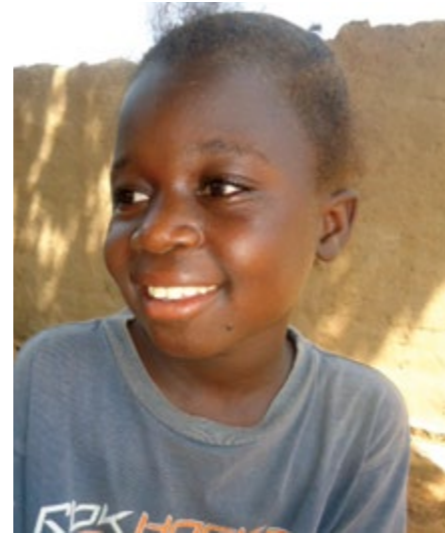
フェリシテ(10歳)が暮らすブルキナファソでは、子どもたちの22%が自国の政治的リーダー・活動家をヒーロー(ヒロイン)として挙げ、18%が家族を、14%が教師を挙げました。 「私はブルキナファソのファーストレディ、ブレース・コンオレ大統領夫人みたいな人になりたい。彼女は子どもたちのことを気にかけてくれるから。」