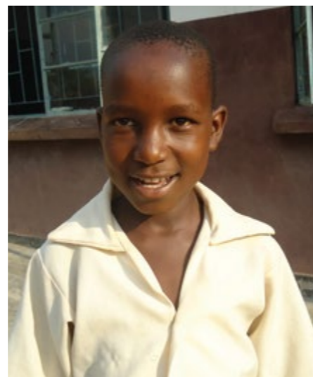
クリストファ(10歳)はザンビアの男の子です。ザンビアの子どもたちの三分の二が法律や規則を増やすと答え、16%が教育の改善を挙げています。 「ぼくだったら、乱暴な人を逮捕して刑務所に送るよう、警察に頼むよ。」

銃を禁止することはアメリカ(21%)とカナダ(15%)の子どもたちにとって優先すべき事項でしたが、調査を行ったアジアとアフリカの国々では、銃の禁止を挙げた子どもはいませんでした。