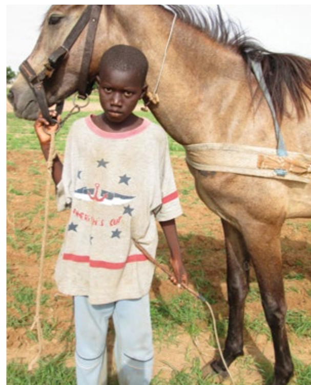
セリーネ(11歳)はセネガルの男の子です。セネガルでは、子どもたちの81%が安全な水へのアクセスや公衆衛生を選びました。