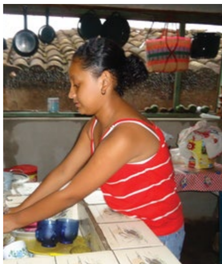
ローリー(12歳)が暮らすホンジュラスでは、子どもたちのほとんどが、誰もが良い教育を受けられることを選び、70%が誠実で意見を聞き入れる政府を選びました。