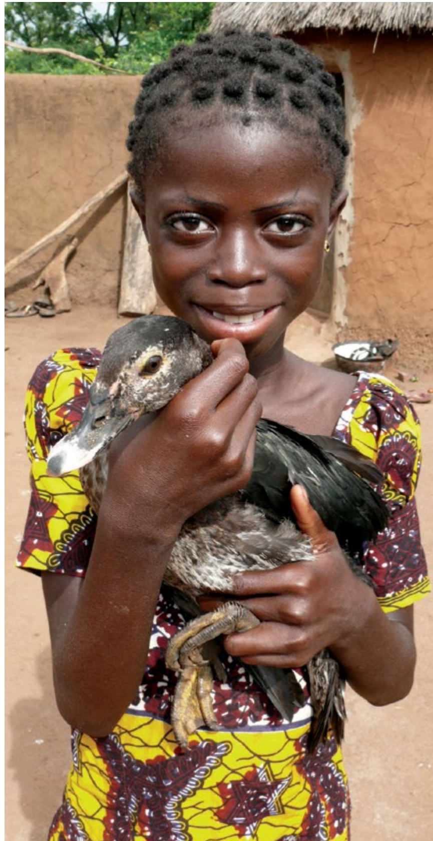
アビーナ(11歳)はトーゴの女の子です。トーゴの子どもたちの約三分の一がスポーツ選手をヒーロー(ヒロイン)に挙げ、政治的リーダー・活動家(26%)、家族(14%)がこれに続きます。