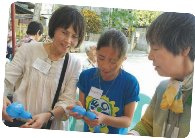
チャイルドにバルーンの作り方を教えています

の心に刻まれました。「手紙では分からない、チャイルドの声や話し方、素振りを知れたこと、家庭の様子を見られたことがよかったです」、「自分の気持ちを自分の言葉で伝えられたことがうれしかった」、「家族みんなで支援している我が家のチャイルドに会えて本当によかった。愛おしい気持ちでいっぱいになりました。」チャイルドと涙を流しながら抱き合う姿や、お互いに恥ずかしそうに会話をする様子、優しくつながれた2つの手と手、あっという間に過ぎていく穏やかな時間。訪問の旅は、喜びと優しさであふれていました。