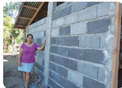
家屋の修復の様子