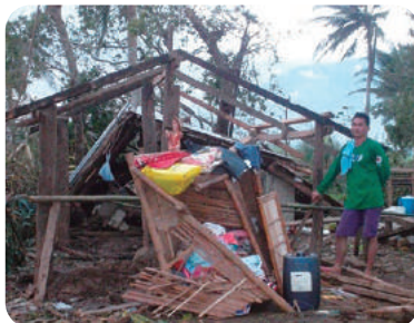
全壊したチャイルドの家

台風の被害はありましたが、皆さまのご支援により2017年5月末には予定通り、地域の自立を果たすことができます。