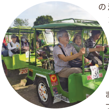
トライシクルに乗って チャイルドの家を訪問しました

参加した皆さまは、地域の人々の温かい歓迎を受けました。フィリピンの一般的な乗り物であるトライシクルやジープニーで移動し、スタッフによる熱心な支援事業の説明に耳を傾けました。また、参加者の皆さまもフィリピンの人々の歓迎に応えるべく、みんなで歌を披露したり、バルーン