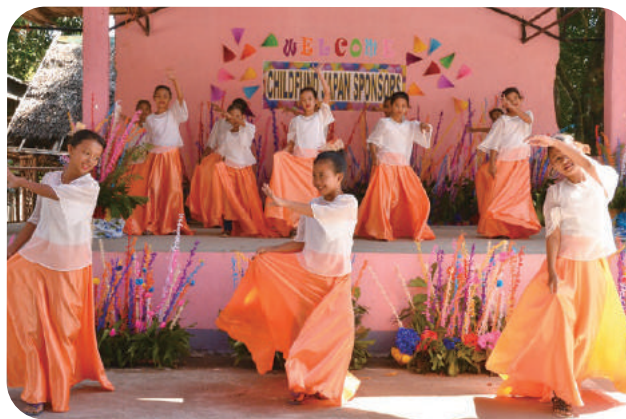
(左)チャイルドとの対面、あっという間にお互いの心が通います (右)チャイルドたちがダンスで迎えてくれました

の心に刻まれました。「手紙では分からない、チャイルドの声や話し方、素振りを知れたこと、家庭の様子を見られたことがよかったです」、「自分の気持ちを自分の言葉で伝えられたことがうれしかった」、「家族みんなで支援している我が家のチャイルドに会えて本当によかった。愛おしい気持ちでいっぱいになりました。」チャイルドと涙を流しながら抱き合う姿や、お互いに恥ずかしそうに会話をする様子、優しくつながれた2つの手と手、あっという間に過ぎていく穏やかな時間。訪問の旅は、喜びと優しさであふれていました。