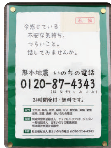
仮設住宅団地の掲示板に掲出されたポスター

支援の一つに、自殺予防のための活動をしている「熊本いのちの電話」との協働があります。被災した方々が通話料金を負担することなく電話相談ができるよう、2016年7月からフリーダイヤルを設置し、チャイルド・ファンド・ジャパンはその通話料や設備の更改を支援しています。いのちの電話の相談員は、2年間の訓練を受けた専門家として、ボランティアで相談にあたっています。「夫と子どもから暴力を受け、自分は車の中で生活している」、「精神的にずいぶん楽になった。いのちの電話に感謝している」など多様な声に耳を傾け、熊本地震で被災した方々に寄り添っています。