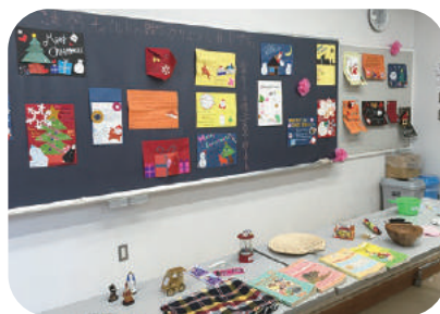
(上)明治学院東村山高校1年生のボランティア委員の皆さん