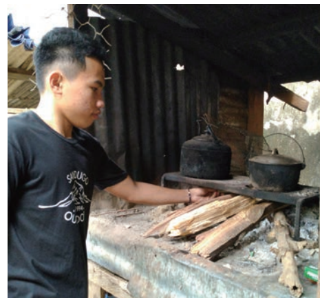
かまどは家の外にあります