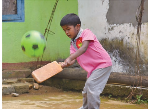
スリランカの子どもたちは、小さなころからクリケットに親しんでいます

クリケットは、スリランカでもっとも人気のあるスポーツです。野球に似ていますが、グラウンドやバットの形、ルールなどに違いがあります。特徴的なのがその試合時間の長さで、一般的には5～6時間、伝統的な形式では最大5日間にも及ぶそうです。スリランカではテレビでも頻繁に放送され、大人から子どもまで慣れ親しんでいるスポーツです。