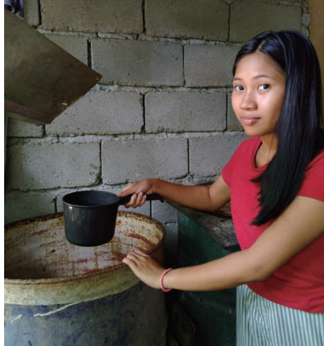
調理にも洗濯にもドラム缶に貯めた水を使っています