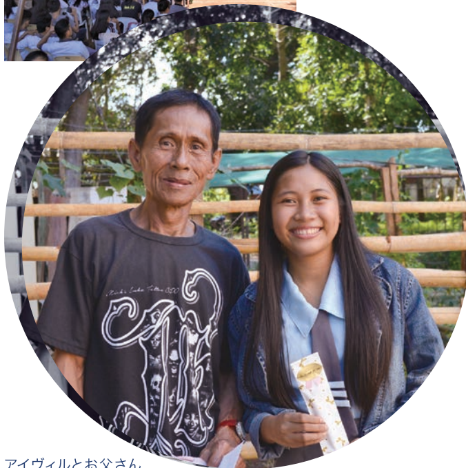
アイヴィルとお父さん